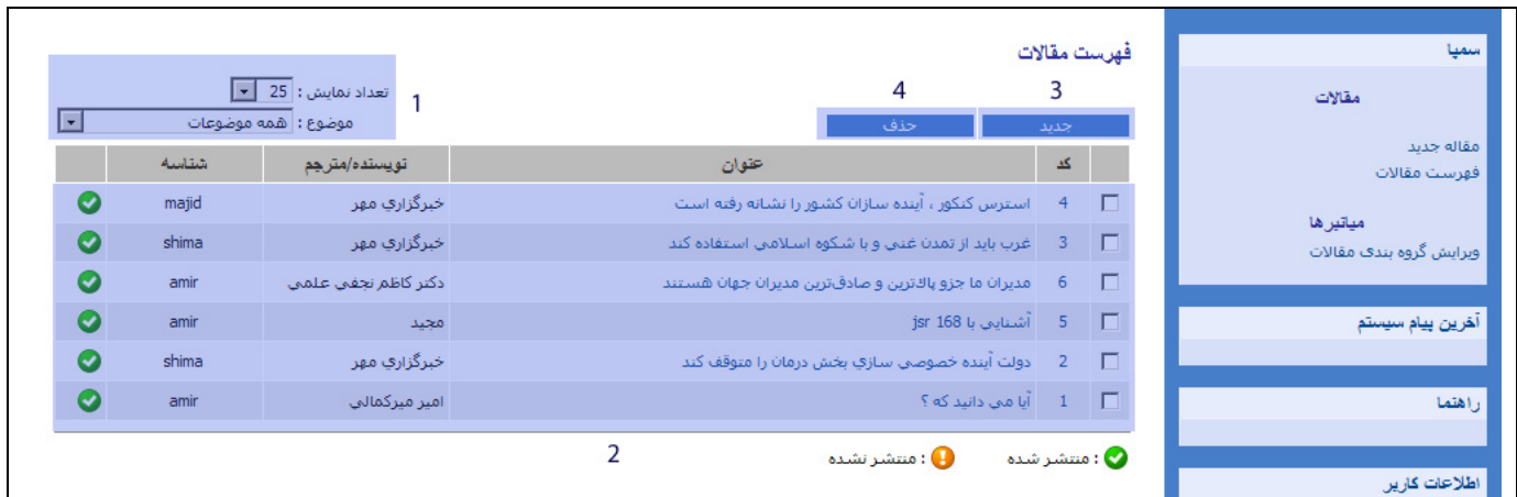
شکل - ۱

شکل - ۱، صفحه نخست سامانه مقالات را نمایش می دهد. حال به شرح جزئیات سامانه می پردازیم.