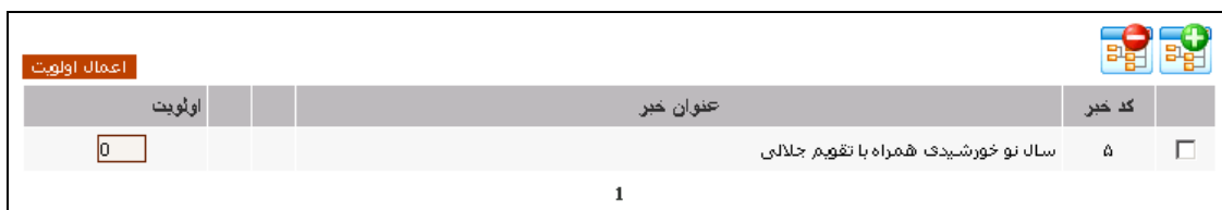
شکل - ۵

در سامانه مدیریت شرکت ها، اگر قابلیت اخبار شرکت فعال باشد، بعد از ذخیره کردن اطلاعات شرکت جدید، یک قسمت هم مانند شکل - ۵ به انتهای صفحه اضافه می شود. به کمک این قسمت می توان اخبار مرتبط با شرکت را به اطلاعات شرکت اضافه کرد.