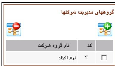
شکل - ۳

بعد از ذخیره شدن مشخصات شرکت جدید، یک قسمت همانند شکل - ۳ به سمت چپ صفحه برای گروه بندی اضافه می شود.