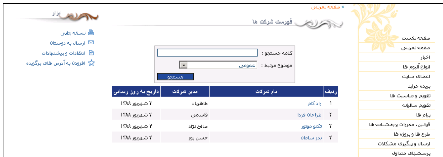
شکل - ۸

با انتخاب این کادر پویا، خروجی آن در سایت مانند شکل - ۸ است.