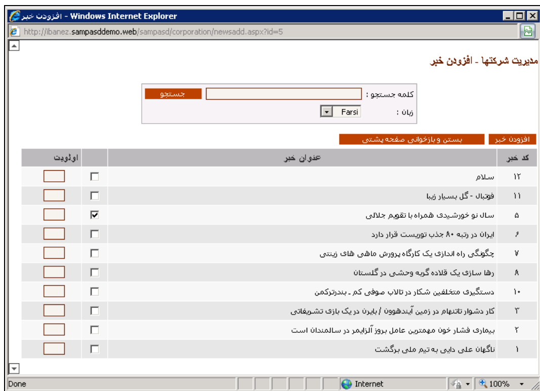
شکل - ۶