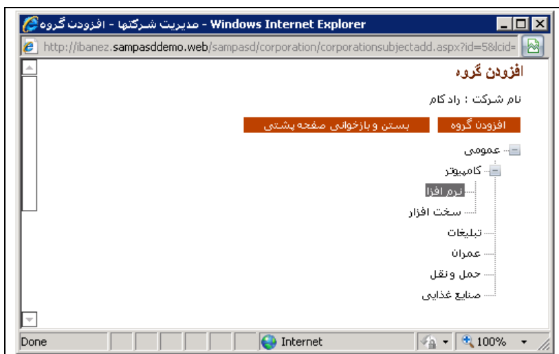
شکل - ۴

به کمک این قسمت می توان مشخص کرد که شرکت به چه گروه هایی تعلق دارد. با کلیک روی دکمه پنجره ای مانند شکل - ۴ باز می شود.