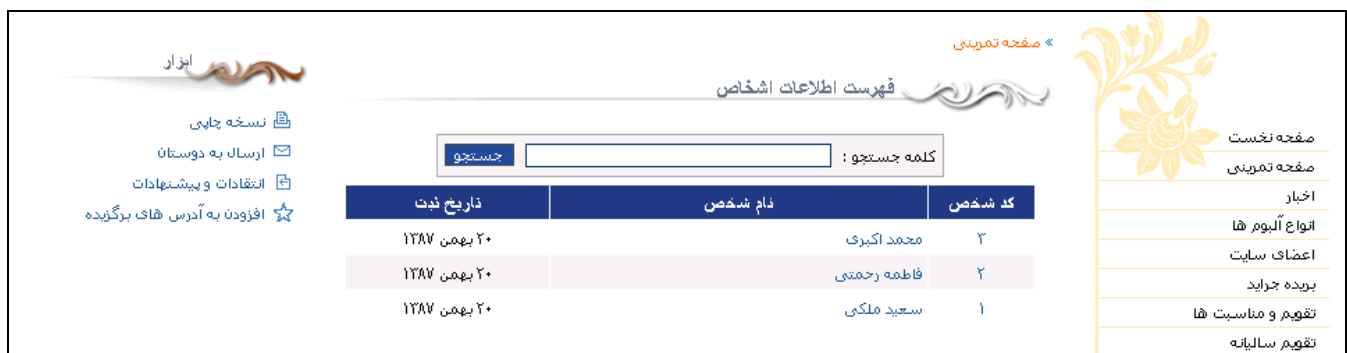
شکل - ۴

با انتخاب این کادر پویا، خروجی آن در وب سایت مانند شکل - ۴ خواهد شد.