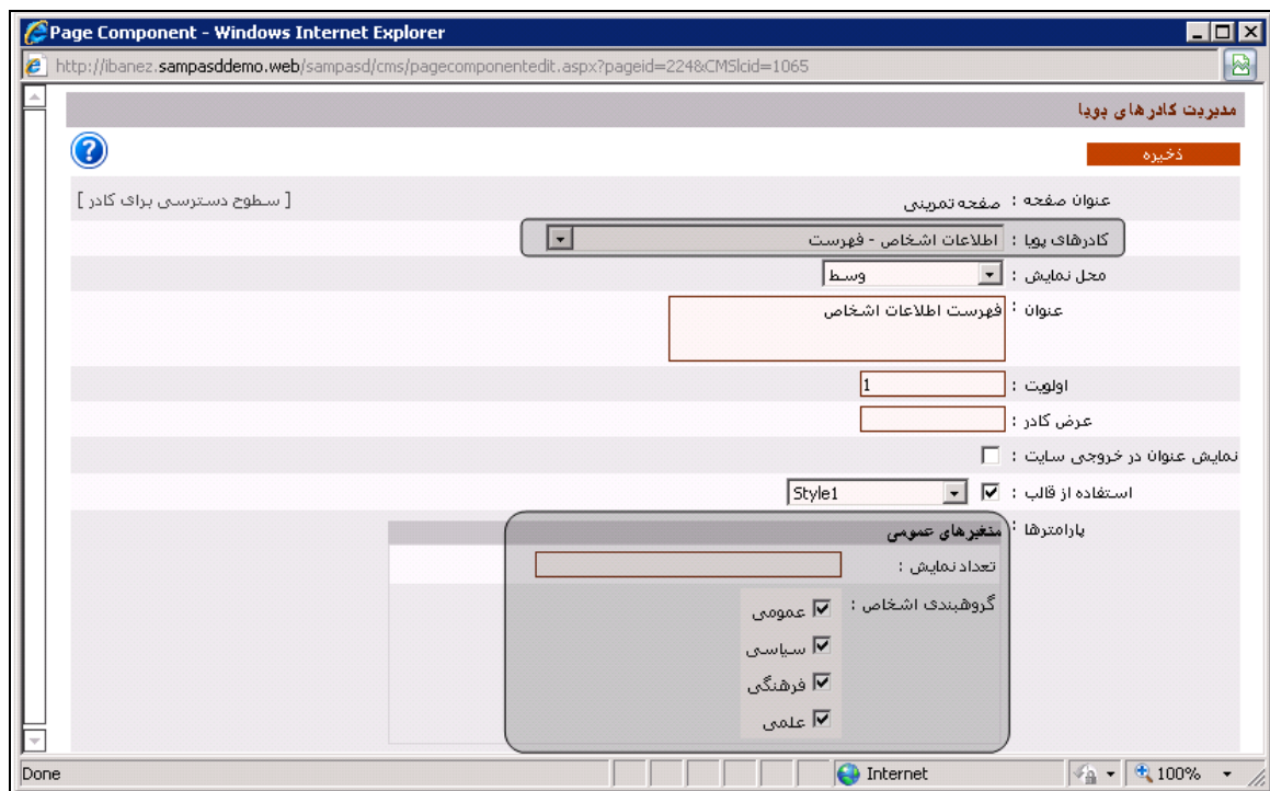
شکل - ۳

هنگام اضافه کردن کادر پویا به کمک سامانه مدیریت محتوا (CMS) برای صفحات سایت، سامانه اطلاعات اشخاص همانند شکل - ۳، یک کادر پویا به نام اطلاعات اشخاص - فهرست را در اختیار قرار می دهد.