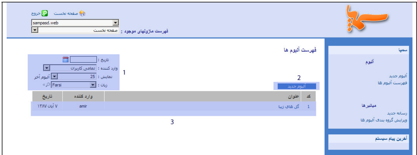
شکل - ۱

از این سامانه به منظور ایجاد آلبوم های تصاویر و نمایش آنها در سایت استفاده می شود. برای ورود به این سامانه کافیست روی شکلک آن در صفحه نخست سمپا کلیک نمایید. با ورود به این سامانه با شکل - ۱ روبرو می شویم.