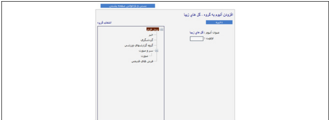
شکل - ۴

برای انتخاب یک گروه، کفایت روی شاخه موردنظر در ساختار درختی موضوعات کلیک کرده و پس از وارد کردن عدد مربوط به اولویت آلبوم در آن گروه کلید ذخیره را بفشارید.