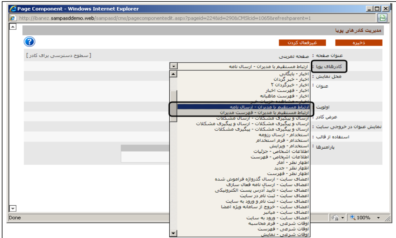
شکل - ۳

هنگام اضافه کردن کادر پویا برای صفحات خود مانند شکل ۳، کادرهای پویای متناظر با این سامانه در فهرست کادرهای پویا (در مدیریت محتوا) با نام ارتباط مستقیم با مدیران - ارسال نامه و ارتباط مستقیم با مدیران - فهرست مدیران در دسترس است که در شکل ۳- آنرا ملاحظه می کنید.