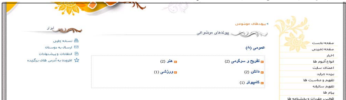
شکل - ۱۴ همانطور که مشاهده می کنید، پیوندها در ۲ ستون نمایش داده شده اند.